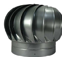
KOMÍNOVÁ ROTAČNÍ HLAVICE DORN 315 mm - 1 KS