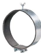
CZ 315 HADICOVÁ UPEVŇOVACÍ SPONA - 6 KS